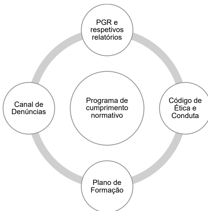
Figura 1- Elementos do programa de cumprimento normativo

Em cumprimento do disposto no Decreto-Lei n.º 109-E/2021 de 9 de dezembro, que estabelece o Regime Geral de Prevenção da Corrupção (RGPC), a Secretaria-Geral da Educação e Ciência (SGEC), assim designada pelo Decreto-Lei n.º 251-A/2015, de 17 de dezembro, adotou o programa de cumprimento normativo constituído pelos elementos infra, tendo como responsável o Secretário-Geral da Educação e Ciência.